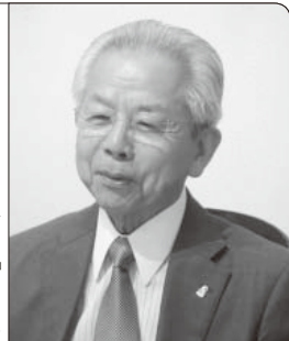
宝石・貴金属「居東屋」会長