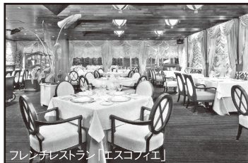
フレンチレストラン「エスコフィエ」