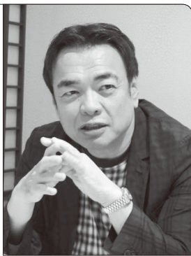
いざわもとひこ 井沢元彦さん 作家

1954年名古屋生まれ。早稲田大学法学部卒。TBS入社後、報道局放送記者時代に「猿丸幻視行」で第26回江戸川乱歩賞受賞(26歳)。31歳で退社、執筆活動に専念。以後、歴史推理、ノンフィクションに独自の世界を開拓。週刊ポストに連載中の「逆説の日本史」は1000回を突破。シリーズ最新刊「逆説の日本史22 明治維新編」までで累計500万部超のベストセラー。大正大学表現学部客員教授。日本ペンクラブ会員。中京独立戦略本部構成員。