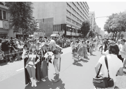
▲今年の「世界コスプレサミット」(7/30～8/7)は、史上最多の30ヵ国が参加。来場者は昨年の24万8千人を超える約30万人と言われている。

やらないほうがいいと、役人は考える。これも縮小、あれも縮小。これじゃあ三英傑も泣いちゃうよね(笑)。