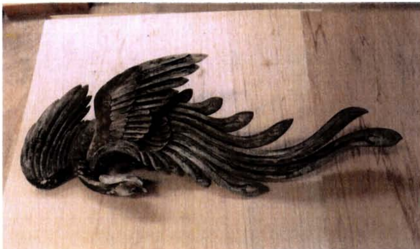
拜殿向拝の手挟の彫刻（山鵲）